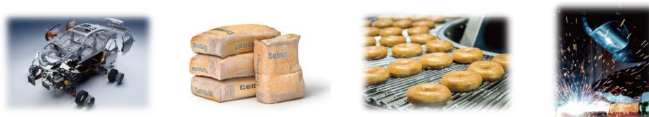
図 3 160 社以上の導入実績