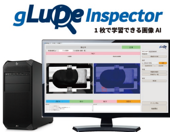
図 1 1 枚で学習できる画像 AI「gLupe」

株式会社システム計画研究所(所在地：東京都渋谷区、代表取締役：門脇 均)は、1 枚で学習できる画像 AI「gLupe」をご導入済みのお客様、および新規導入をご検討中のお客様の双方を対象に、グループ会社・他拠点への横展開支援と新規導入向け学習ツール特価を組み合わせた、年度末キャンペーンを実施いたします。既存拠点での導入実績を起点にしたスムーズな展開と、新規導入時の初期負担軽減の両立を目的とした特別プログラムです。